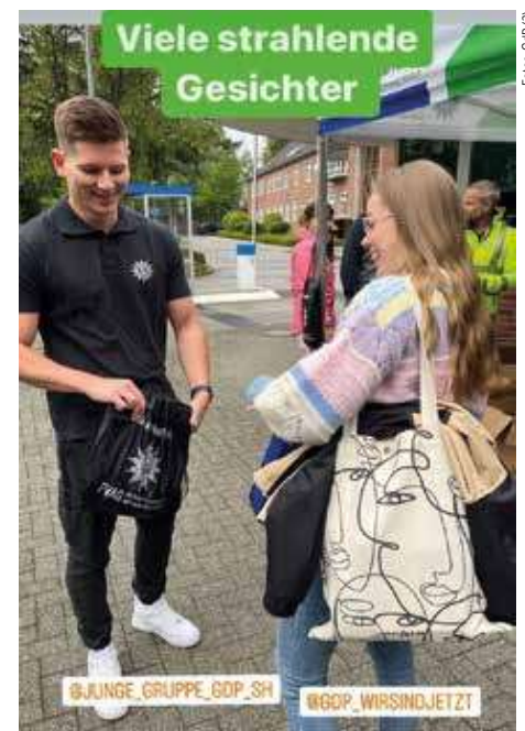
Gute Stimmung bei den GdP-lern und dem Polizeinachwuchs.